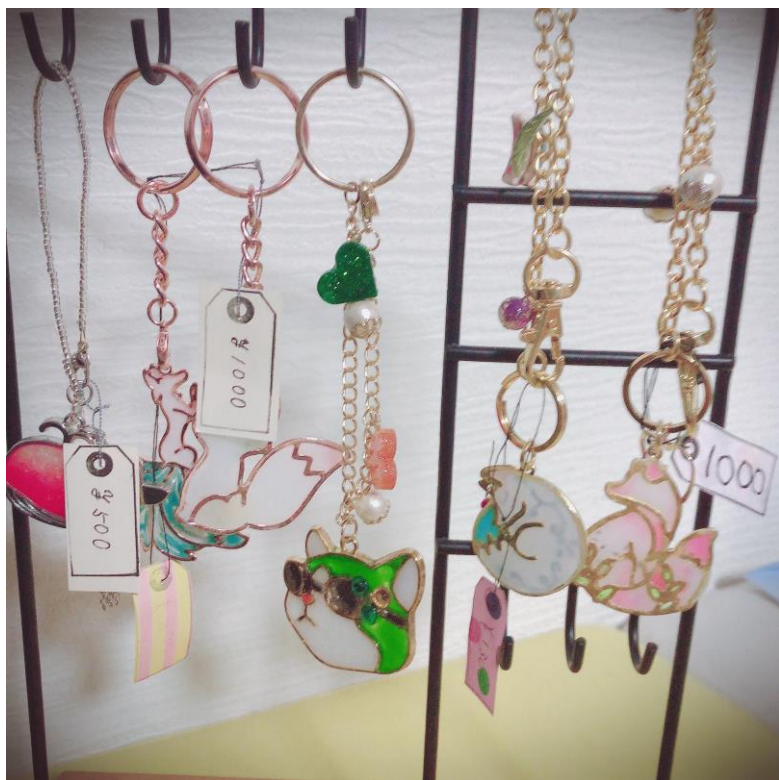
○「狐や猫のレジンキーホルダーとバッグチャーム」