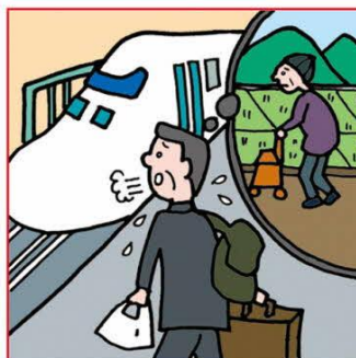
遠くにひとりで住む高齢の親が心配で頻繁に通っている