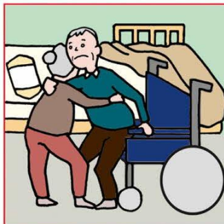
健康不安を抱えながら高齢者が高齢者をケアしている