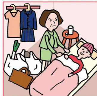
仕事と介護でせいっぱいでほかに何もできない