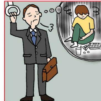
障害や病気の家族の世話や介護をいつも気にかけている