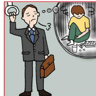
障害や病気の家族の世話や介護をいつも気にかけている