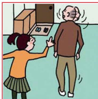
目を離せない家族の見守りなどのケアをしている