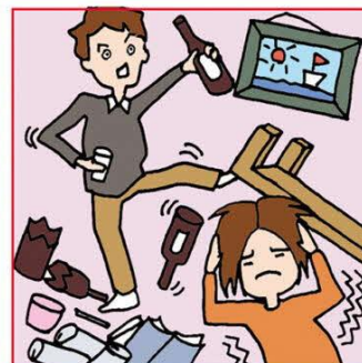
アルコール・薬物依存やひきこもりなどの家族をケアしている