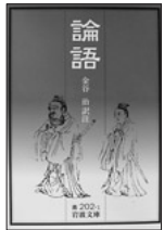
1963年7月刊 定価840円(税込) 岩波文庫