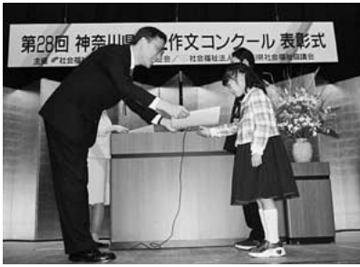
神奈川県知事賞受賞のようす