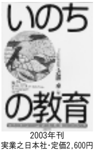
2003年刊 実業之日本社・定価2,600円

「いのちってなに？福祉って？」人のいのちが粗末に扱われ、それが蔓延する時代には共に生きる福祉の思想は育たない。時代潮流である地域福祉という新しい理念が根を張り進展するには、見過ごされてきた、福祉の原点とも言うべき「いのちへの思い」を取り戻すことが必要だと思う。本書は誕生から病気、老い、死までの「いのち」の大切さを真正面から見つめる中で、子どもたちに愛・誇り・信頼・夢・人生について教えようとする学習指導書。このような教育が普及すると、しっかりした福祉の思想が育つ。教育と福祉の現場で人を育てる志は同じだとしみじみ思う。