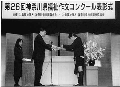
神奈川県知事賞受賞のようす