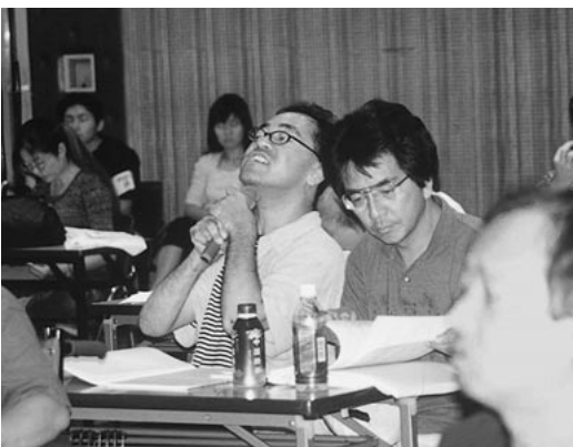
参加者からは制度充実を願う熱い声が寄せられた