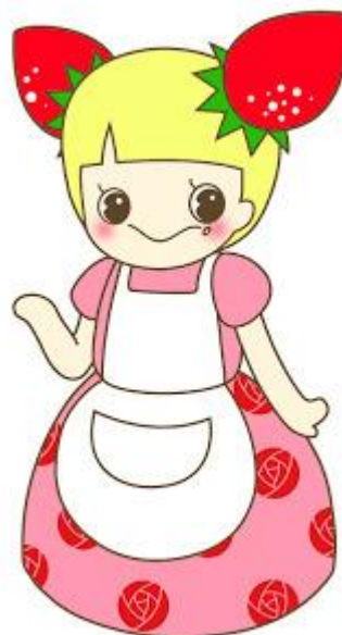
ひらつか花アグリ キャラクター 「あぐりちゃん」

社会福祉法人神奈川県社会福祉協議会権利擁護推進部 かながわ成年後見推進センター 電話 045-312-5788 FAX 045-322-3559 E-mail kouken@knsyk.jp