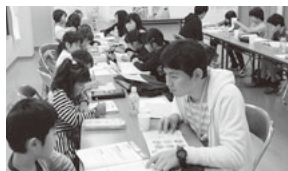
持参する学習課題を真剣に取り組んでいく

この学習会は指導を目的にするのではなく、子どもの普段の様子を知る機会にするために開催され、大学生にボランティアとして協力してもらい、みんなで楽しめる「みんなの時間」を