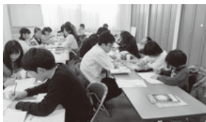
先生が見ていてくれるので、頑張れる子どもたち

そこで主任児童委員と話し合いを重ね、地区社協の応援を得て「師岡こども学習会」が立ち上がりました。