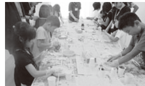
うまく弾むか！スーパーボール作りに夢中

この学習会は地区社協の協力を得ることで、担い手にも参加者にも新たな広がりが生まれました。居場所を作ることで、子供会や町会の役員、保護者との交流が生まれ、情報を広く得ることができるようになったと感じています。