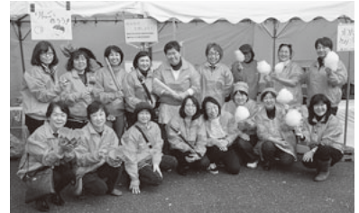
横浜市主任児童委員連絡会の皆さん

横浜市主任児童委員連絡会は、ゴールとなる山下公園で第2回から毎年参加しています。綿菓子の無料配布、趣向を凝らした手作りコーナーで、参加した子どもたちに楽しんでもらっています。