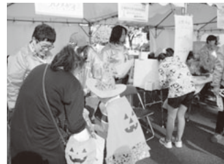
出展ブースの様子

ゴール地点でのブースには、栃木県をはじめ多くの地域からも参加があります。ご当地オレンジリボンのグッズも入手することができます、収