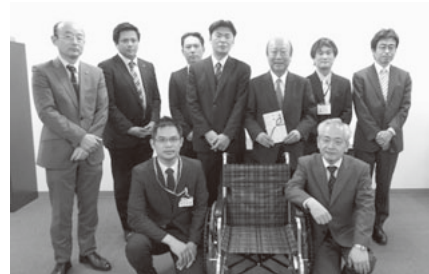
(株)ツルハ関東第一店舗運営部より県内の介護老人保健施設へ車いすを寄贈いただき、館長(後方右から4人目)に感謝状を贈呈