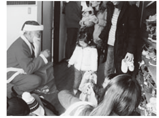
サンタにプレゼントをもらって嬉しそう

参加して下さる保護者を見て、幼児期の子育ては大変かもしれませんが楽しい時でもあり、「頑張ってる」と声をかけながらも、私達スタッフも子どもたちから元気をもたらしていることに感謝の気持ちでいっぱいです。