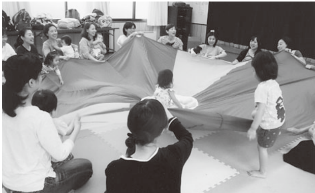
地域で一緒に子育て。バルーンをゆらして楽しそう

子育て中のお母さん、0歳から3歳ぐらいまでのお子さんを対象にした「地域で一緒に子育て」は、お母さんの仲間作り、息抜き、悩み相談等子育ての手助けになればと思っています。