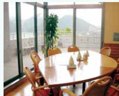
デッキテラスからは、美しい湖畔や山並みが眺望でき、お腹だけではなく心も満たされます

協による無料での絵本の貸し出し、ぬくもり絵本コーナー」と地区社協活動展示コーナーも併設されています。