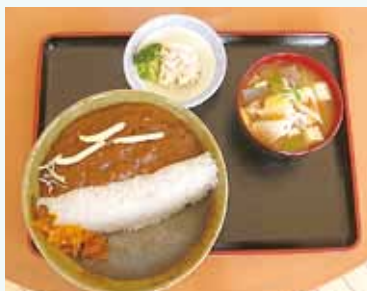
おすすめの「相模湖ダムカレー」は、サラダとみそ汁がついて500円 調理ボランティアスタッフ募集中！ 食材の差し入れ大歓迎！