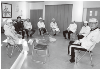
小学校の先生やボランティアが集まり情報交換を行う懇談会

各隊員の活動場所によって、交通量、特徴、条件、注意事項等が違ってきますので、月に2回の懇