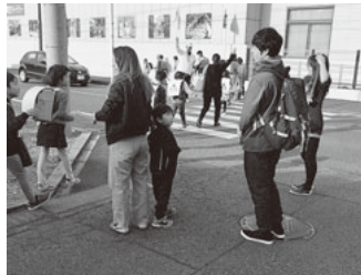
横断歩道で児童を見守る様子

私たちは「川尻小学校安全ボランティア団体」原宿地区の会員です。学校から登録・認定された名札を付けて、各地域で児童の登校集合場所から川尻小学校までの登下校指定通学路内にある横断歩道に立ち、列を成して渡る児童の誘導及び安全見守りを行っています。