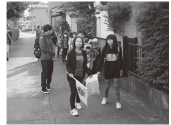
見守りには児童の親御さんも参加

また、当地区では児童の親御さんたちが黄色い旗をバトン代わりに、交代制で朝の誘導見守りを行っており、大変助かっています。