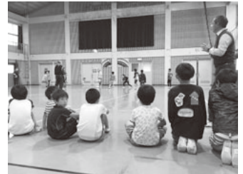
ニュースポーツ(バウンズボール) を体験して

遊友クラブは子 どもたちのホームグラ ウンドである学校施 設を開放し、年間を 通しスポーツ・手作 りおやつ・工作・お話 会・お花教室・絵手