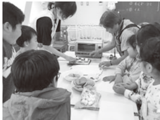
マシュマロサンドが焼きあがるのを まだかまだか見つめる子どもたち

一昔前では考えられないような豊かなものに 囲まれながら、一人で遊ぶ子どもや友達とも家 の中で遊ぶ子どもが多く、外遊びが減少すると ともに友達との外での遊び方を知らない子ども が増えています。特に放課後に、地域で“のび のび”と集団で遊ぶ機会が減少しています。